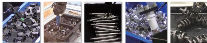
導入例① 部品の整列や工作機械への投入

大箱にバラバラに積まれた部品を3次元ピッキングします コンベアに搬送したり、工作機械へ精度よく投入したり 用途はさまざまです