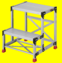
材料セット用踏み台